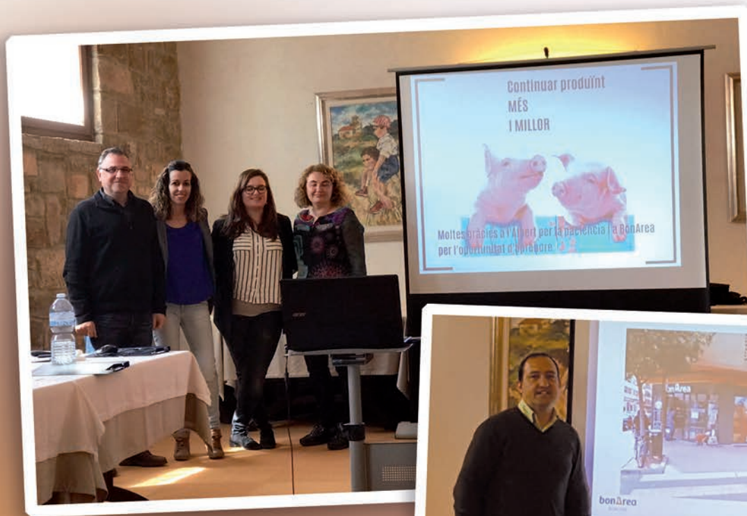
Grupo del Proyecto de marketing de porcino

¡Enhorabuena a todos los participantes por el trabajo bien hecho!