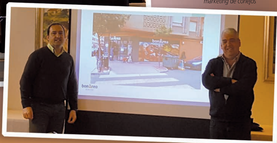
Grupo del Proyecto de marketing de conejos